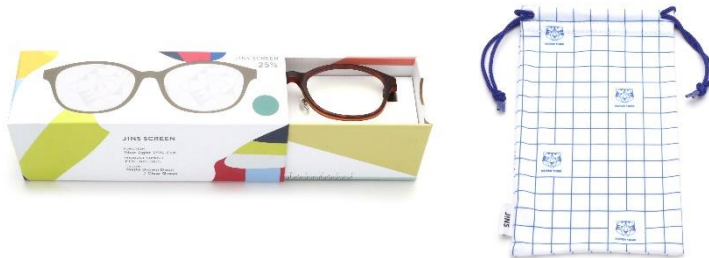
オリジナルパッケージ及びオリジナルソフトケース